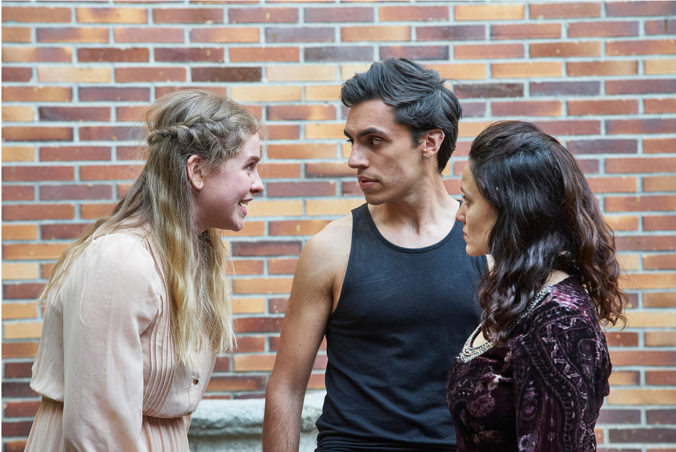
"Los Gigantes en Shakespeare" Escuela para el Arte del Actor en la Corrala de c/ Madera, 24