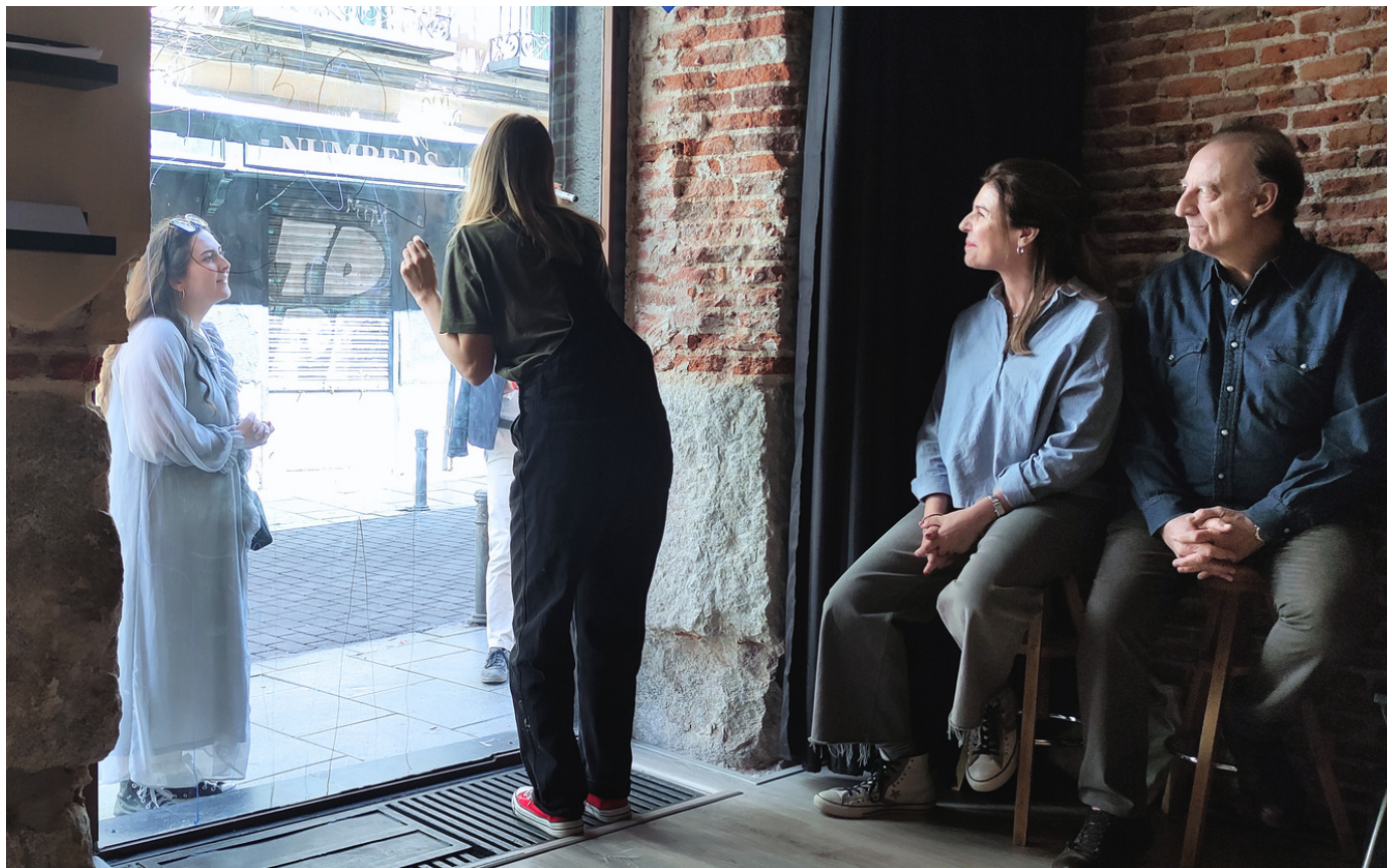
"Imagina una ventana". 5 de Velarde