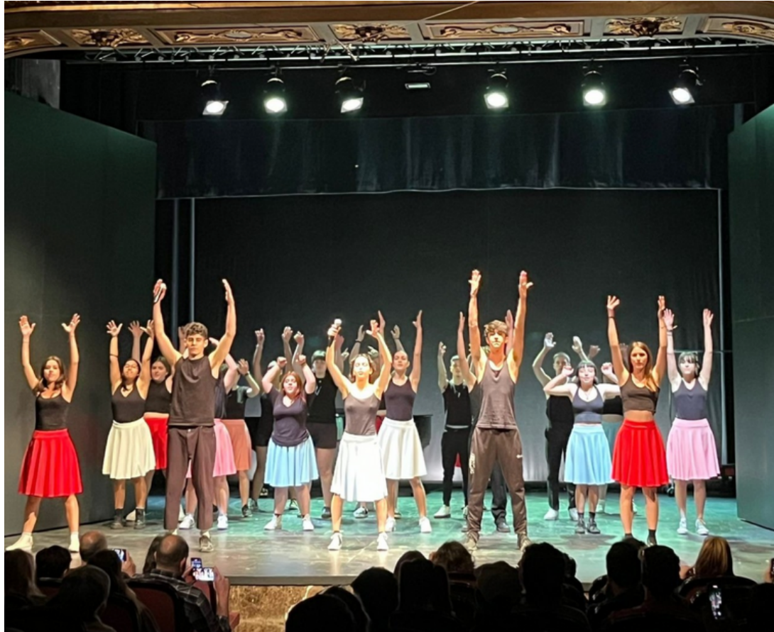
"Fragmentos Teatro Musical" IES Lope de Vega, Bachillerato Artes Escénicas en el Teatro Bauer