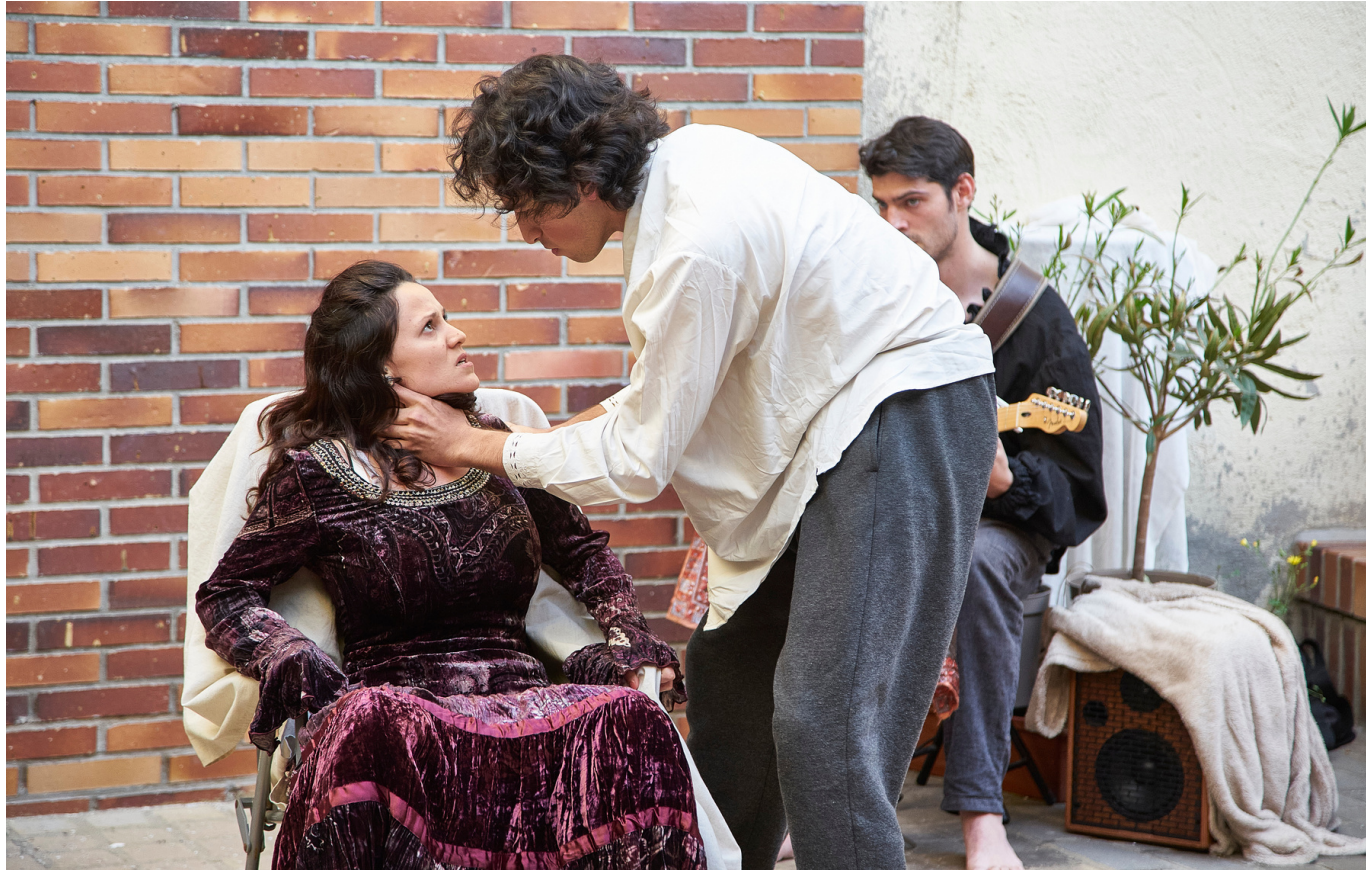
"Los Gigantes en Shakespeare" Escuela para el Arte del Actor en la Corrala de c/ Madera 24