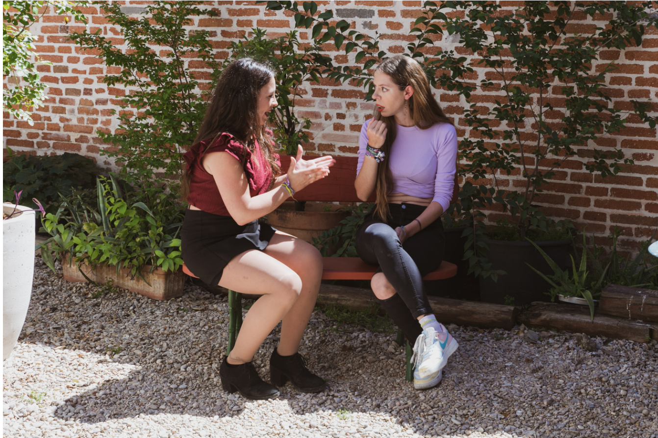
"Microteatro en Calle Noviciado" La Íntegra Teatro en el Patio de Noviciado