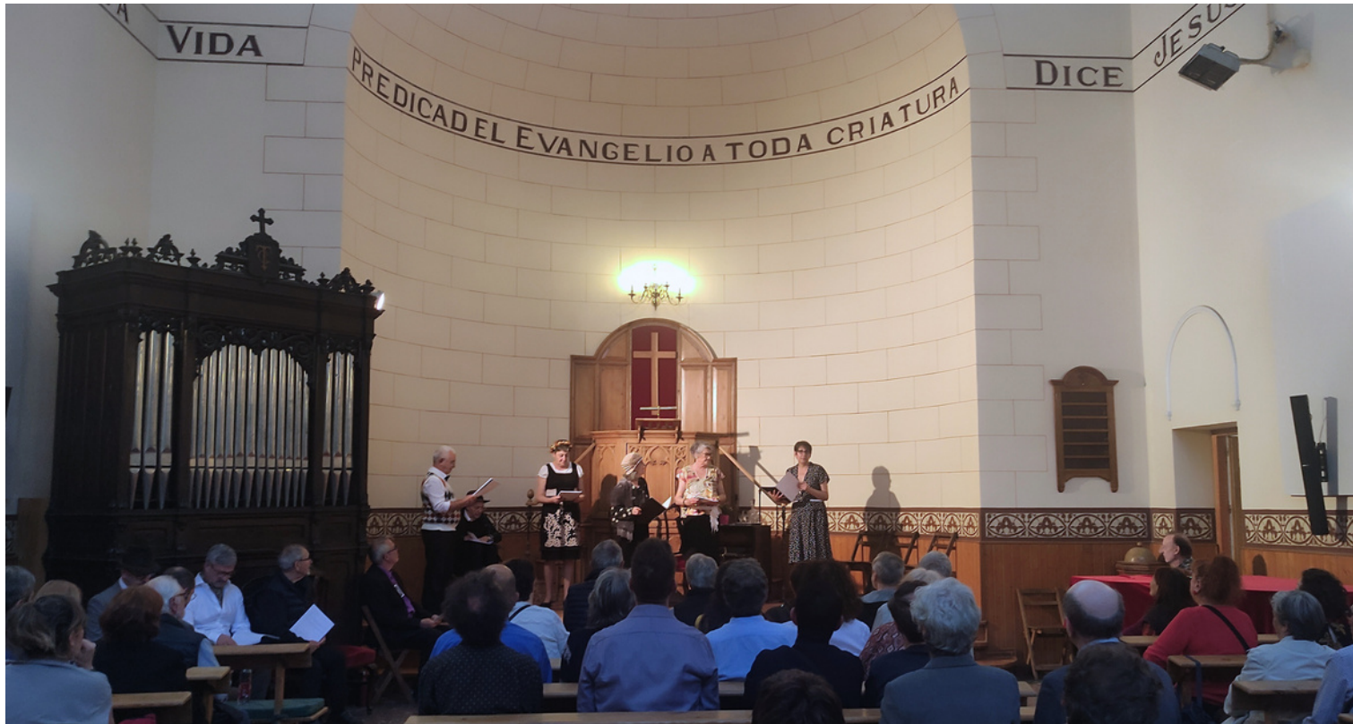
"Lectura Dramatizada de Tartufo" La Troupe de Malasaña en la Iglesia Protestante de El Salvador