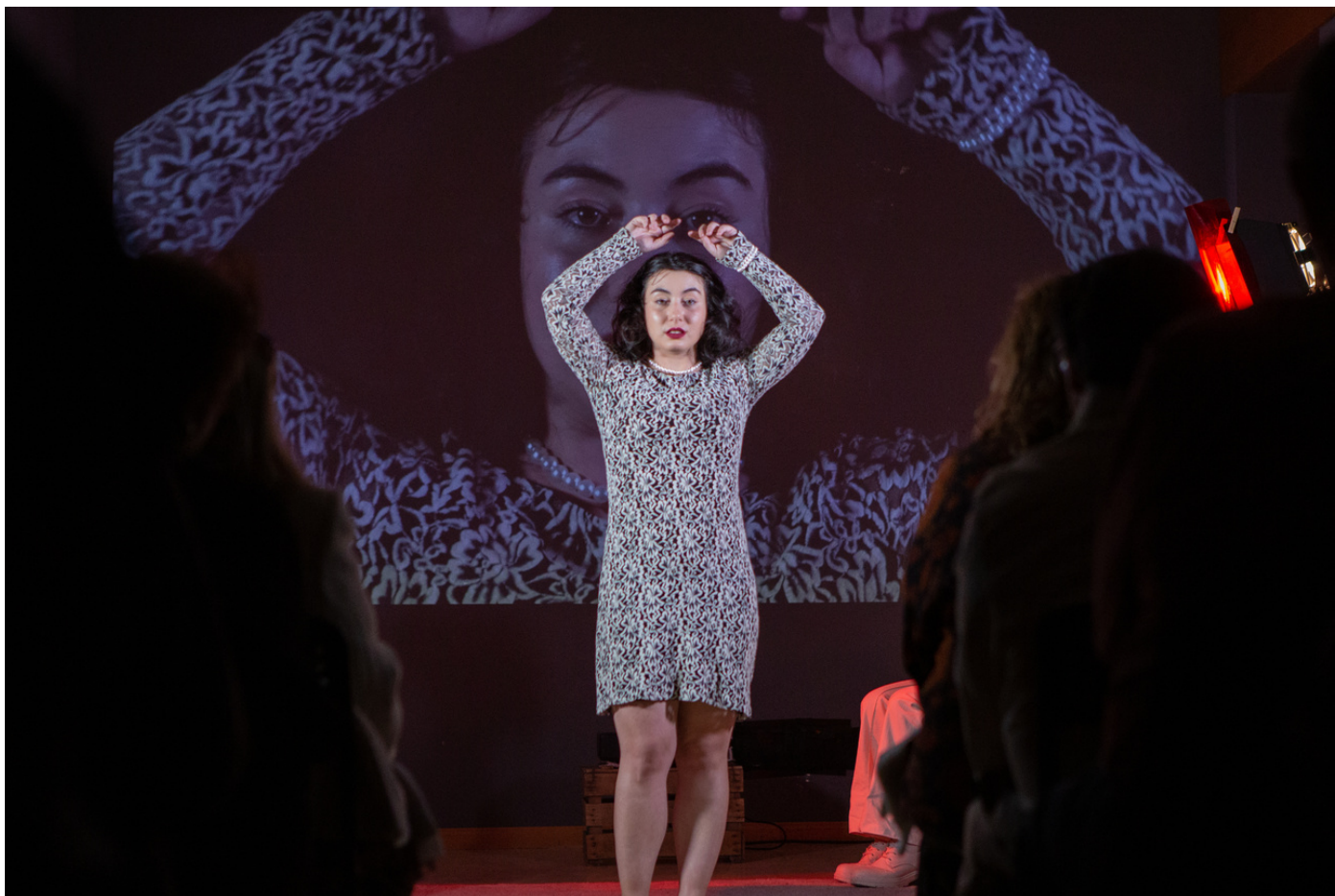
"Conversaciones imposibles" Escuela Actores Madrid