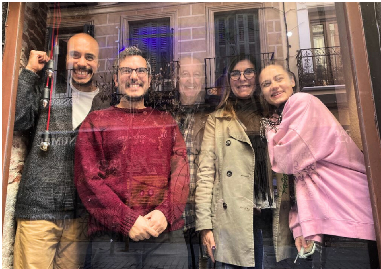
"Imagina una ventana". 5 de Velarde