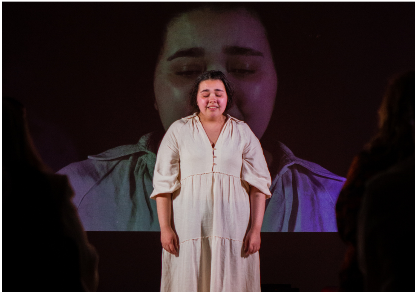
"Conversaciones imposibles" Escuela Actores Madrid