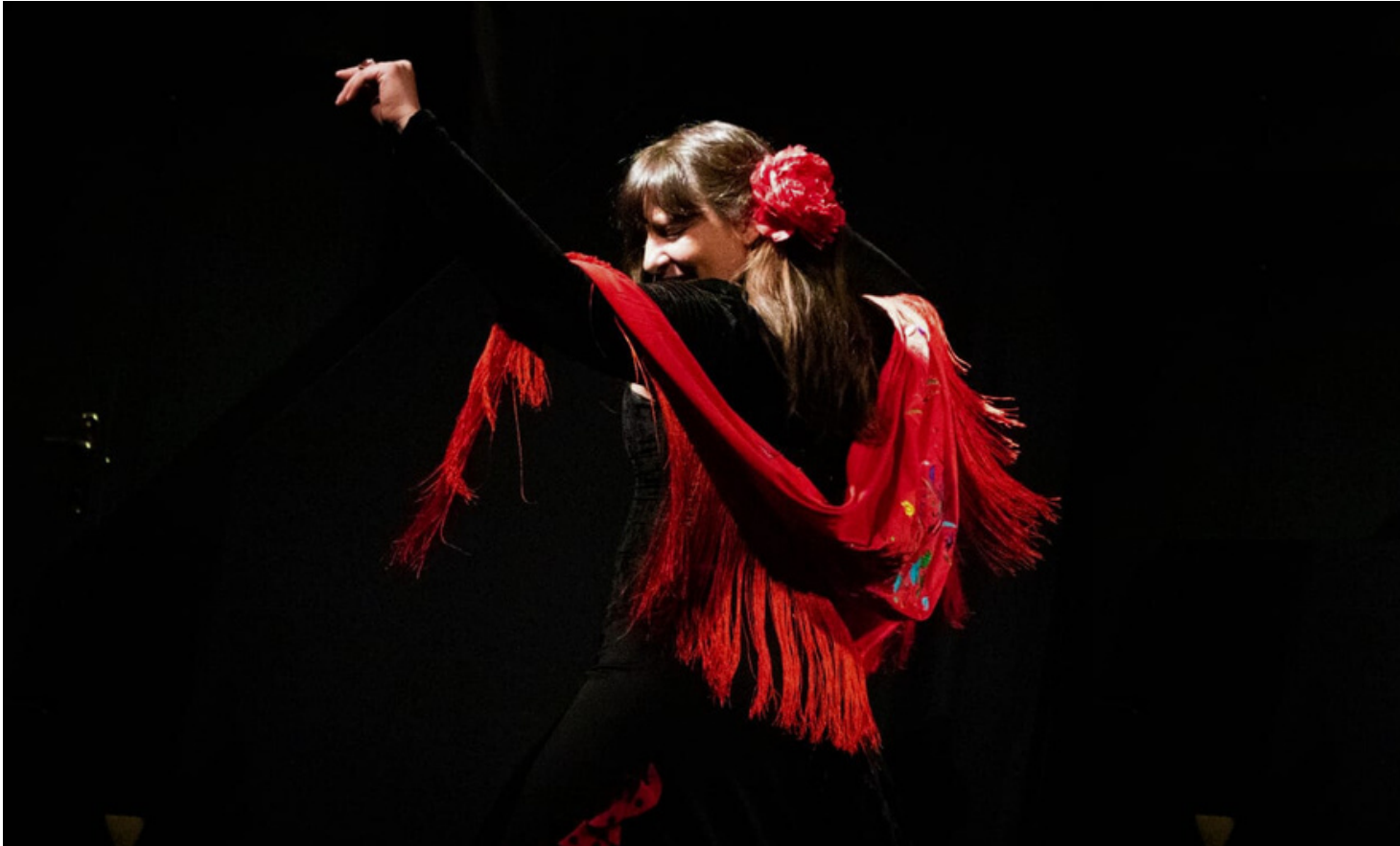
"Alma de copla". La Madriltera