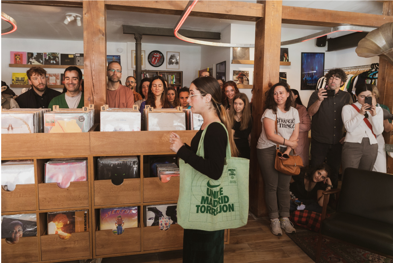
"Microteatro en Calle Noviciado" La Íntegra Teatro en Marilians Records