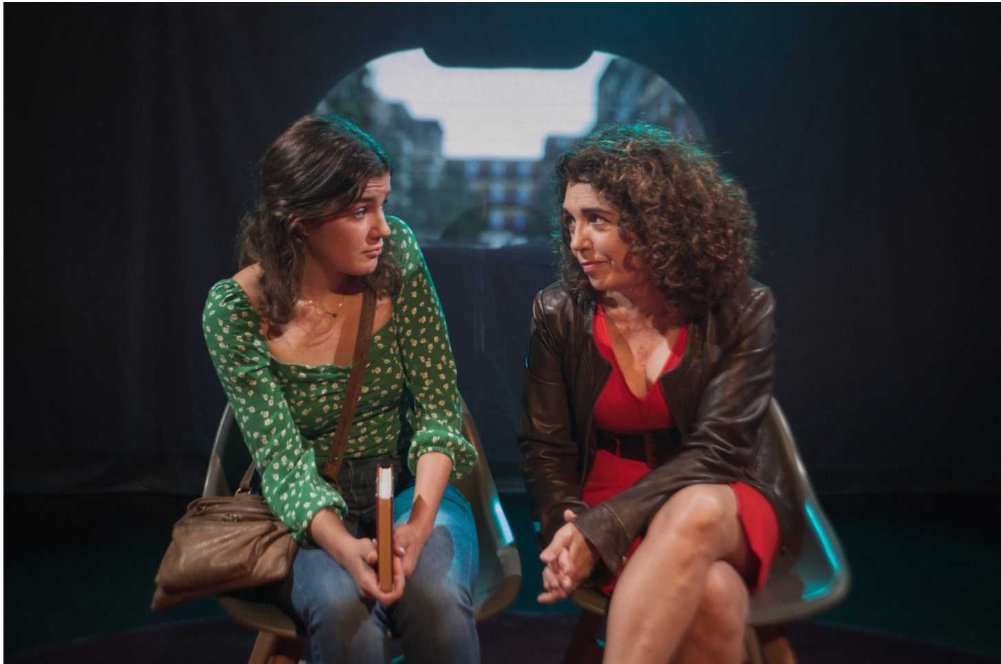
"Dime que todo está bien". Teatro Nueve Norte