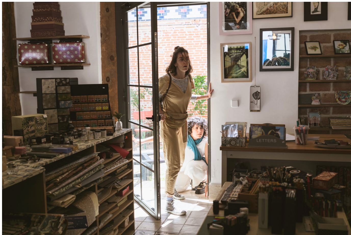
"Microteatro en Calle Noviciado" La Íntegra Teatro en Bomagui