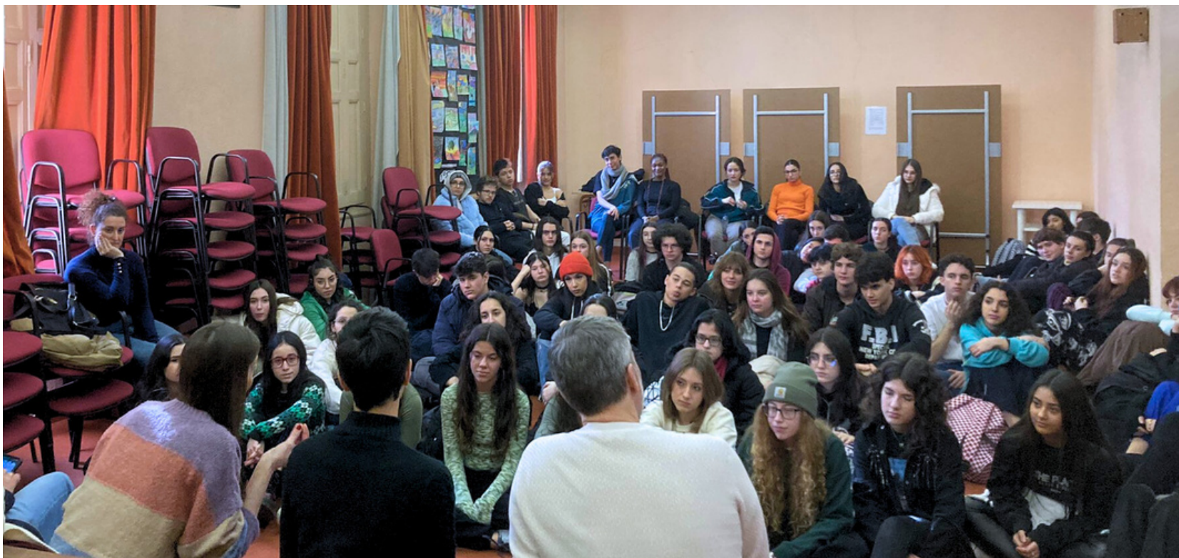
Charla de la Escuela para el Arte del Actor con alumn@s del IES Lope de Vega, Bachillerato Artes Escénicas